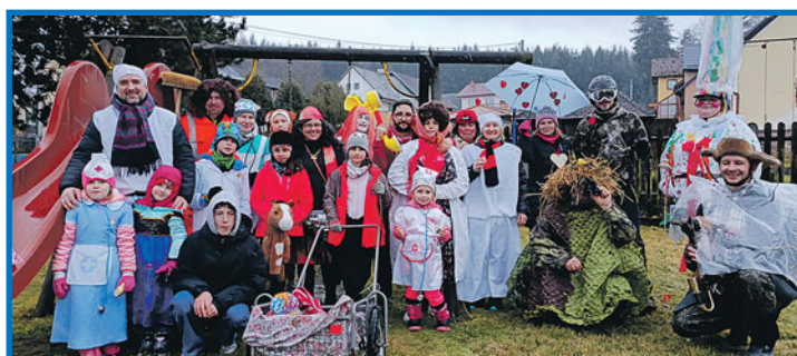
Masopust ve Starci 14. února.