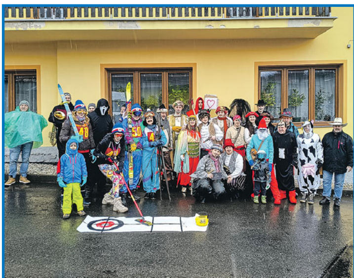
Společná fotografie masopustního průvodu, který na obvyklé trase Loučim – Nová Víska a Libkov, kde se končilo maškarním bálem, pořádala TJ Sokol Loučim. Z. Huspek