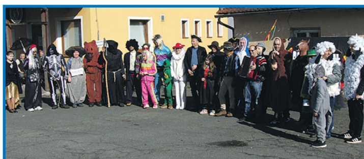
V Černíkově se masopust konal 28. února pod záštitou místních dobrovolných hasičů. Masek se sešlo hojně, pohoštění bylo připraveno a počasí průvodu přálo. Jitka Kauerová