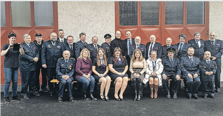
Tradiční společné foto před hasičskou zbrojnicí v Pocinovicích.