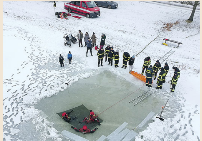
Hasiči na „ledové pláži“ i v ledové vodě.