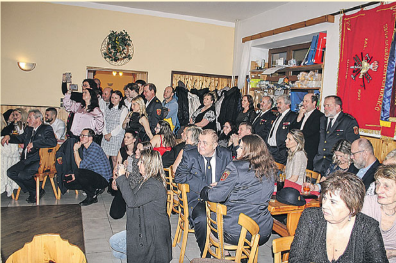
Vystoupení TS Avanti Domažlice sledovali přítomní s velkým zájmem.

Na poslední lednovou sobotu připadá v Loučimi každoročně stěžejní událost v činnosti místních hasičů – bál. Zatímco jeho návštěvníci mají starost, co na sebe, pořadatelé mají starostí daleko víc. Zajistit kapelu je třeba s dostatečným, nejlépe ročním předstihem (letos to byla opět Taky Taky z Mrákova), zajistit předtančení (letos TS Avanti Domažlice), nakoupit 10 top cen do tomboly, a tu od občanů i sponzorů dodanou očíslovat a uspořádat na parapety oken v sále, připravit předchozí den chuťovky (mají na starosti ženy hasičů), a potom už jen čekat, kolik lidí vlastně přijde? Prognózy se různí, někdo říká málo, někdo hodně... letos to bylo snad nejméně za poslední roky a byli to nejen hasiči z okolních sborů a místní, ale i hodně mladých! Avanti předvedlo hned dvě úspěšná vystoupení, Rokerky (kolem 15 let) a dámy (kolem 25 let), Taky Taky hráli s chutí a všichni se skvěle bavili. A poněvadž v tombole vyhrávala všechna prodaná čísla, odcházeli do mrazivé noci plně sněhu všichni spokojeni.