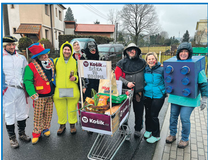
Masopust v Mrákově.