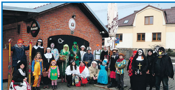
Brniřovský masopustní průvod prošel návší v sobotu 7. února a svou cestu zakončil na sále obecního úřadu taneční zábavou.