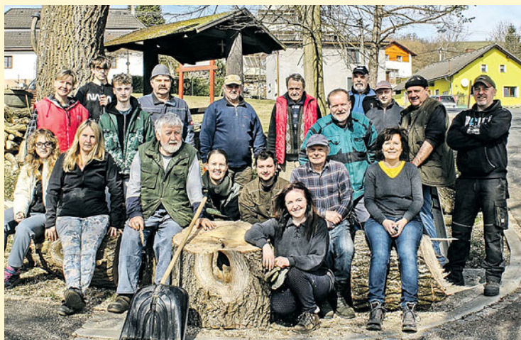
Účastníci sobotní brigády v Loučimi.

Na hlavní jarní a celorepublikový úklidový den (letos 28. 3.) nečekali v Loučimi a do díla se pustili už ve druhém březnovém týdnu. Nejprve seniorská parta shrabala loňské listí u hřbitova, kolem autobusové zastávky a částečně i na návsi, v sobotu 14. března pak nastoupila mladší generace, aby upravila plochu návsi po celkové rekonstrukci v souvislosti s opravou průtahu obce.