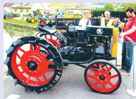
I takové unikáty je možné spatřit v Brnířově, jako je tato ŠKODA HT 18, r. v. 1927.

Srdečně zveme na už 14. ročník Setkání starých traktorů a veteránů v Brnířově, který se uskuteční na brnířovské návsi v sobotu 30. května. Uvidíte jedinečné stroje minulosti a užijete si příjemnou atmosféru s technikou, která psala dějiny a postupně modernizovala zemědělství. Nadšené budou i děti, které rády vyzkouší každý starý traktor.