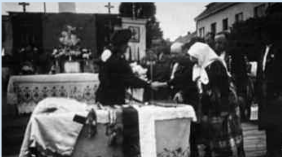
Křest historického praporu roku 1946 na náměstí ve Kdyňi. Poté následovala vojenská přehlídka a lidová veselice. Foto archiv krajského spolku.

Od roku 1883 se v Praze sdružují členové chodského krajského spolku, aby v našem hlavním městě šířili a udržovali národopisné tradice svého kraje. Osud je do Prahy zavál zejména za prací. Stesk po domově v dobách silícího národního obrození koncem předminulého století přiměl i rodáky z jiných oblastí Čech a Moravy, aby zakládali spolky a udržovali své tradice daleko od domova.